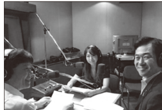
ラジオ「JAPAN MOVE UP」FM東京