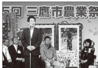
高橋侑子選手×三鷹市農業祭 トークショー