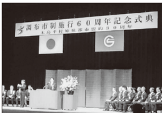
調布市制施行60周年記念式典