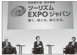
ツーリズムEXPOジャパン

現場の声、地域の声を政策に変え、日本の課題解決に正面から取り組み、結果を出す政治を実現してまいります。