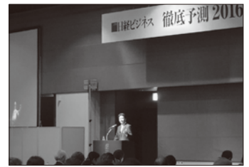
日経ビジネス「徹底予測2016」