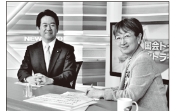
テレビ「国会トークフロントライン」TBS