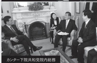
カンター下院共和党院内総務