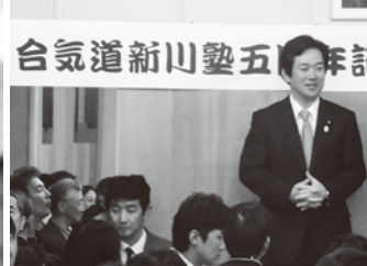
合気道新川塾5周年記念式典