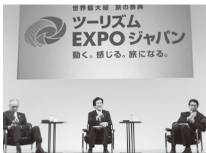
ツーリズムEXPOジャパン

の素スタジアム周辺も会場となります。世界中からアスリートや観光客が訪れるこの機会をとらえられるよう、地域の取組をしっかりと応援していきます。