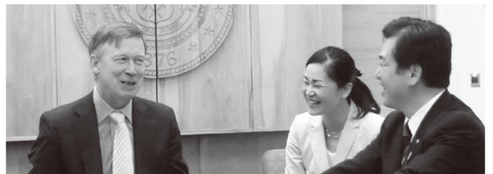
コロラド州知事会談

観光まちづくり先進事例の視察や地方創生推進人材の育成に関する日米協力にかかる協議を行うため、8月米国を訪問しました。サンフランシスコ連銀も訪問し、米国や中国経済の先行きについて意見交換も行いました。