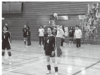
調布市レディスバレーボール連盟大会