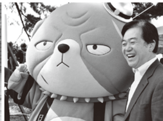
狛江市古代いかだレース