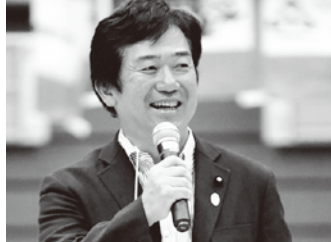
プロバスケットボールプレシーズンマッチ