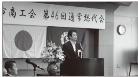
稲城市商工会総会

域内消費の喚起、新規開拓や地域のブランド力の向上などを地方創生の観点から後押ししました。