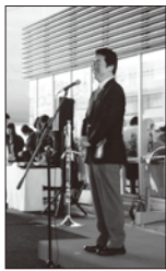
オープニングイベント