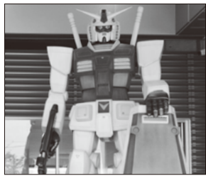
ガンダムのモニュメント

ガンダムとシャア専用ザクの大型モニュメントが、JR南武線「稲城長沼駅」高架下に登場しました。稲城市観光施設「いなぎ発信基地ペアテラス」も4月23日にオープンし、稲城の特産品や魅力、観光情報を市内外に向けて発信しています。稲城市や民間事業者と協力し、実現に努めました。