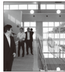
健康プラザのプールを視察

稲城市立病院に隣接する健康プラザは、「からだ」と「こころ」の健康増進の場として親しまれています。稲城市と連携し、隣接する米軍の土地一部活用について交渉し、実現したものです。また多摩川の高規格堤防事業など、市や都と協力しつつ、安心安全な稲城のまちづくりをすすめています。